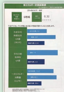
省エネルギー計算結果 (出カイメージ)